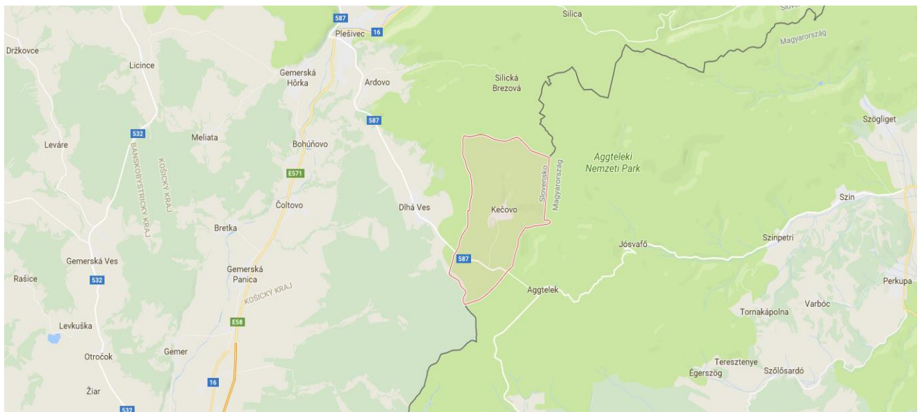
Obrázok 1 Mapa polohy obce Kečovo

Obec Kečovo so svojím katastrálnym územím s rozlohou 13,573 km 2 spadá pod územie Košického samosprávneho kraja. Leží mimo hlavných ciest na južnom okraji vápencovej Silickej planiny, ktorú pokrývajú mladotreťohorné usadeniny. Obec administratívne patrí pod okres Rožňava. Charakter okresu je priemyselno-poľnohospodársky s výrazne rozvinutým spracovateľským priemyslom. Zvláštnosťou je bohatstvo podzemných priestorov – krasových a ľadových jaskýň, viacerých priepastí, závtov, vyvieraciek. Atraktívne prírodné prostredie tvoria Národný park Slovenský raj, Stolické a Volovské vrchy a predovšetkým Slovenský kras – najväčšie krasové územie v strednej Európe. Z nerastných surovín sa avyskytuje železná ruda, azbest a mastenec.